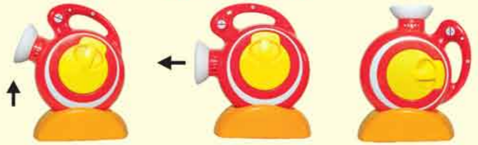
שינוי זווית לפי בחירה